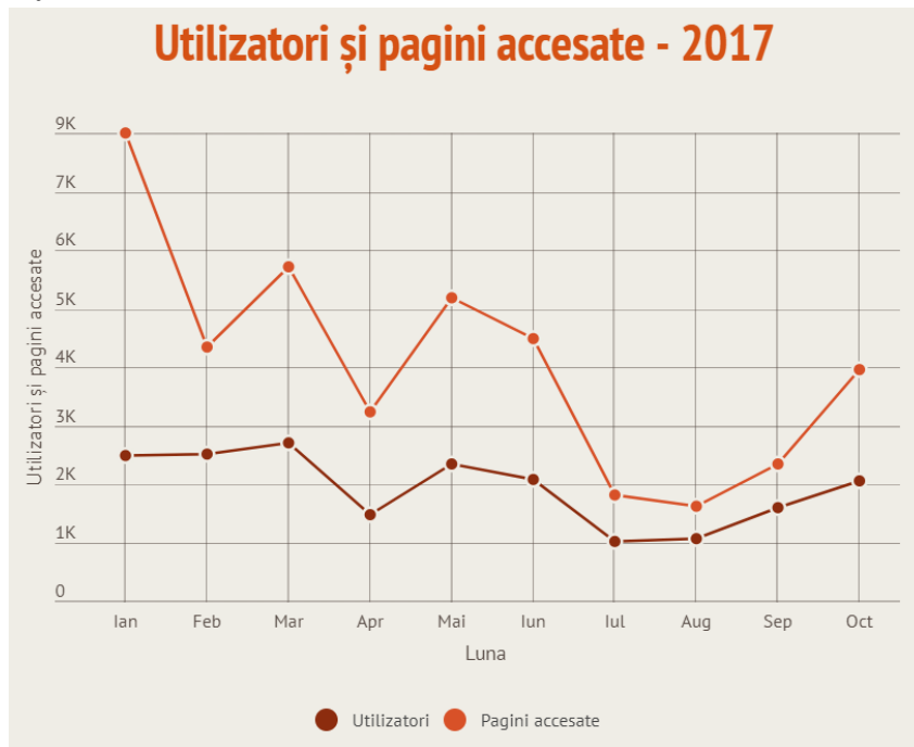
Grafic 1 Statistici de utilizare BVS în intervalul 01.01.-31.10.2017

Organizarea în funcție de tipul materialului digitalizat în cadrul BVS (cărți, studii, colecții) este completată de indicarea fiecărui material prin minim trei cuvinte cheie. Această etichetare facilitează utilizatorilor identificarea materialelor în funcție de interes și conturează un profil al domeniilor de interes și al ofertei editoriale a bibliotecii digitale. Cele mai frecvente cuvinte cheie sunt prezentate în Figura 1 : tranziție (38 de materiale), România (26 de materiale), politică (25 de materiale) etc.